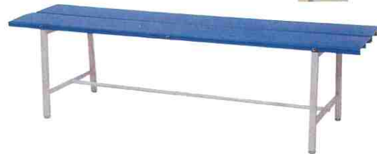
TC-122 プラスチックベンチ

サイズ：W1500×D420×SH400 座面：硬質塩化ビニール カラー：ブルー・ホワイト