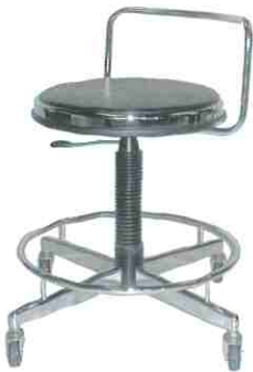
TC-117 オペレーターチェア

サイズ：φ380×SH510~690 H+145 張地：レザー カラー：ブラック